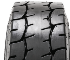
SOLIDEAL AIR 561