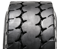
SOLIDEAL AIR 570