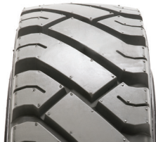
SOLIDEAL ED + NM