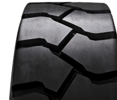
SOLIDEAL HAULER LT