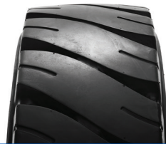
SOLIDEAL PORTMASTER HD