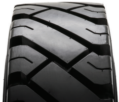
SOLIDEAL AIR 550