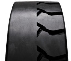
SOLIDEAL HAULER HA-TR