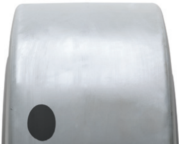
SOLIDEAL PON 775 NMAS