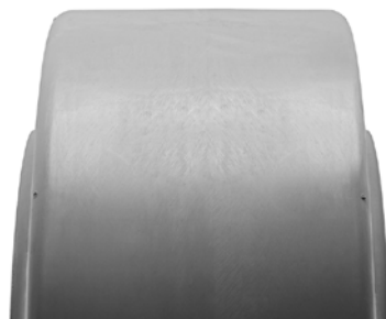
SOLIDEAL PON 555 NM