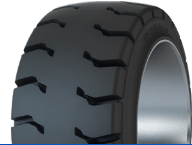
SOLIDEAL PON 552 MAGNUM SEMI