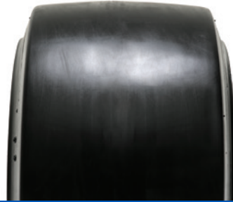
SOLIDEAL PON 555