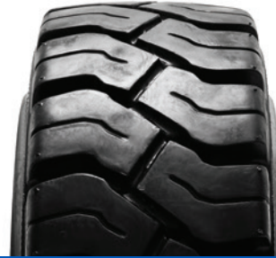
SOLIDEAL PON 550