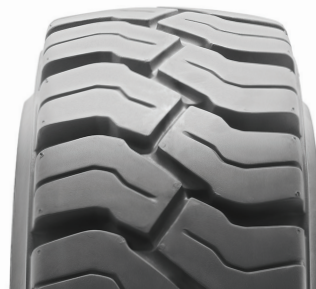
SOLIDEAL MAGNUM TR NM