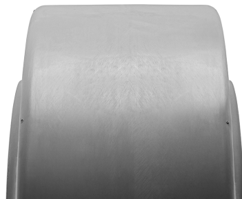
SOLIDEAL MAGNUM SM NM