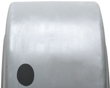
SOLIDEAL PON 775 NMAS