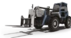
CHARIOTS TÉLÉSCOPIQUES COMPACTS