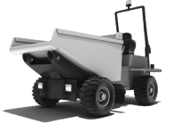
PNEUS POUR MINI- TOMBEREAUX