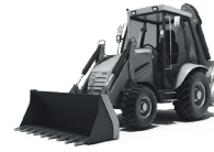
PNEUS POUR TRACTOPELLES