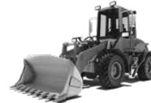
PALE GOMMATE COMPATTE