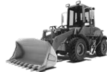
CARGADORES DE RUEDAS COMPACTOS