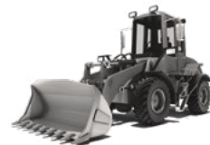
KOMPAKTOWE ŁADOWARKI KOŁOWE