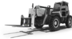
REIFEN FÜR TELESKOPLADER