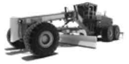
REIFEN FÜR GRADER