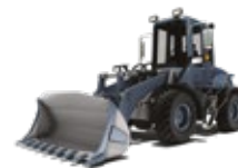
KOMPAKTOWE ŁADOWARKI KOŁOWE