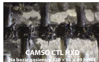
CAMSO CTL HXD Na bazie gąsienicy 320 x 86 x 49 HHBE