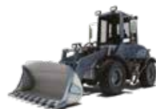
CARGADORES DE RUEDAS COMPACTOS