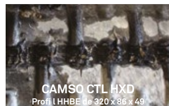
CAMSO CTL HXD Profil LHHBE de 320 x 86 x 49