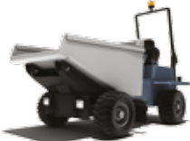
PNEUS POUR MINI- TOMBREAUX