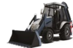
PNEUS POUR TRACTOPELLES