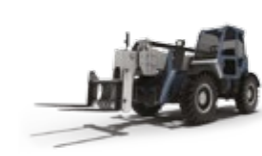
PNEUS POUR CHARIOTS TÉLESCOPIQUES