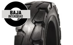
SOLIDEAL RES 330