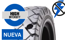
SOLIDEAL RES XTREME NMAS