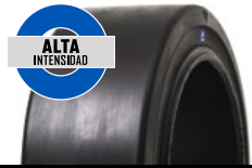
SOLIDEAL PON 775