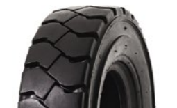
SOLIDEAL HAULER LT