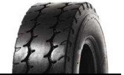
SOLIDEAL AIR 570