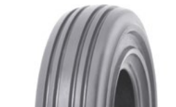
SOLIDEAL RIB NM