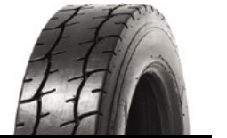
SOLIDEAL AIR 561