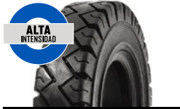
SOLIDEAL RES 660 XTREME SERIES