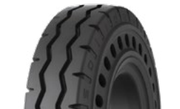
SOLIDEAL SOLIDAIR ZZRIB