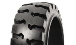
SOLIDEAL ECOMATIC TRACCIÓN