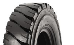
SOLIDEAL PORTMASTER HD

Por favor visite camso.co , connect.camso.co o consulte a su representante de ventas para más información.