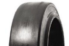
SOLIDEAL ECOMATIC LISA