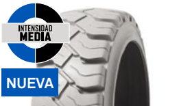
SOLIDEAL PON 550 NM