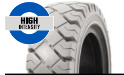
SOLIDEAL RES XTREME NM