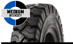
SOLIDEAL RES 550 MAGNUM SERIES