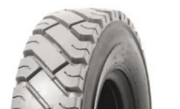
SOLIDEAL ED PLUS NM