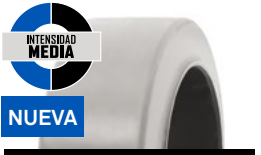
SOLIDEAL PON 555 NM