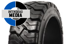
SOLIDEAL PON 550