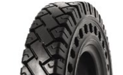
SOLIDEAL SOLIDAIR LT