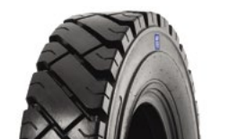
SOLIDEAL AIR 550