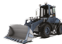
KOMPAKTOWE ŁADOWARKI KOŁOWE